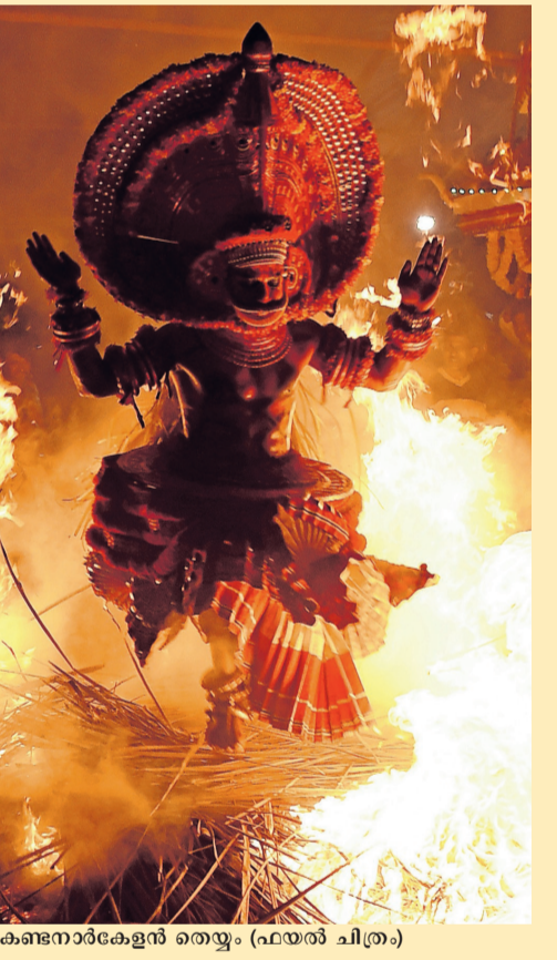
കണ്ടനാർകേളൻ തെയ്യം (ഫയൽ ചിത്രം)

കാഞ്ഞങ്ങാട് • വടക്കിന്റെ ദൈവങ്ങളായ തെയ്യങ്ങൾ കാവുകളിലും തറവാടുകളിലും ഉറങ്ങാടുന്ന ഈ തെയ്യക്കാലത്താണ് സംസ്ഥാന സ്കൂൾ കലോത്സവം. തുളുനാടൻ കുന്നുകൾ ഇറങ്ങി മലബാറിന്റെ ഉത്തര മേഖലകളിലേക്കു പടർന്ന തെയ്യങ്ങൾ പരിസ്ഥിതിയുടെ, വിശ്വാസത്തിന്റെ, സംസ്കാരത്തിന്റെ, കാർഷിക ജീവിതത്തിന്റെ, അതിജീവനത്തിന്റെ, പ്രതിഷേധത്തിന്റെ, മതസൗഹാർദ്ദത്തിന്റെ... അങ്ങനെ പലതിന്റെയും പ്രതീകമാണ്. ഒരു ജനതയുടെ ക്ഷേമത്തിനും പരിപാലനത്തിനും സൗഹാർദ്ദത്തിനുമായി നിലകൊള്ളുന്ന ശക്തിയെ വിശ്വാസികൾ ദൈവം എന്നു വാഴ്ത്തുന്നു. ദൈവം എന്ന പദത്തിൽ നിന്നു പിറവി കൊണ്ടതാണു 'തെയ്യം'. ജില്ലയിലെ മലയൻ, വണ്ണാൻ, വേലൻ, നെൽകാടാർ, അഞ്ഞൂറ്റൻ, പുലയൻ, പരവൻ, ചൊവർ തുടങ്ങിയ സമുദായക്കാരാണു പ്രധാനമായും തെയ്യം കെട്ടുന്നതും രാവിലെ മുതൽ വൈകിട്ടുവരെ വിവിധ കാവുകൾ സന്ദർശിച്ചാൽ കലോത്സവത്തിന് എത്തുന്നവർക്കു തെയ്യം കാണാം.