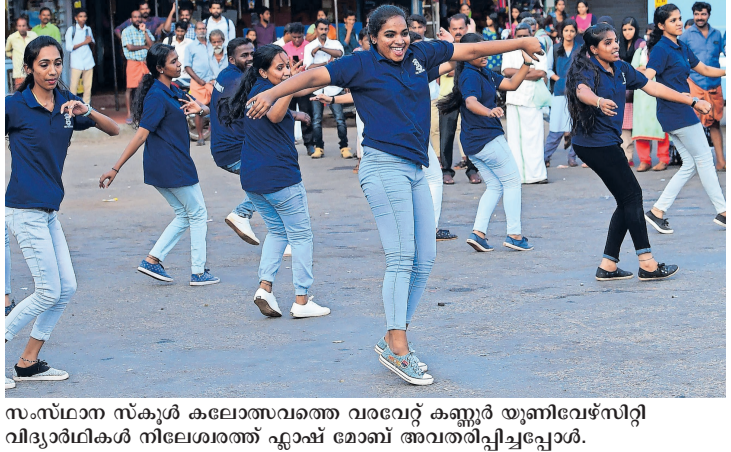
സംസ്ഥാന സ്കൂൾ കലോത്സവത്തെ വരവേറ്റ കണ്ണൂർ യൂണിവേഴ്സിറ്റി വിദ്യാർഥികൾ നിലേശ്വരത്ത് ഏഷ് മേഞ്ച് അവതരിപ്പിച്ചപ്പോൾ.